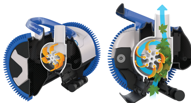
V-Flex®: Turbine mit mobilen Schaufelblättern, um große Schmutzteile einzufangen